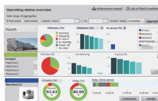
运转状况一览画面

此外，还可以监视其他公司生产的CNC机床，并通过将其连接到远程生产基地来实现整体监视。